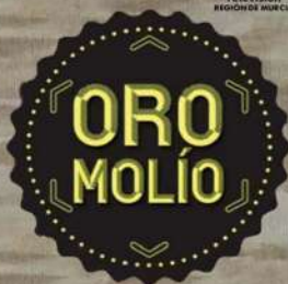
ORO MOLÍO PROGRAMA DIVULGATIVO - 7 REGIÓN DE MURCIA