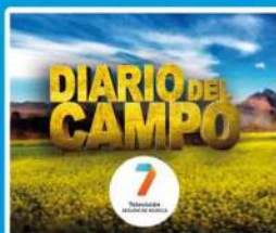
Diario del Campo 7RM