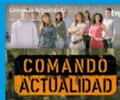
Comando Actualidad TVE