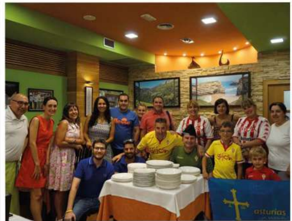
Grupo de Asturias que siempre que viene a Águilas visita “Casa Menéndez”