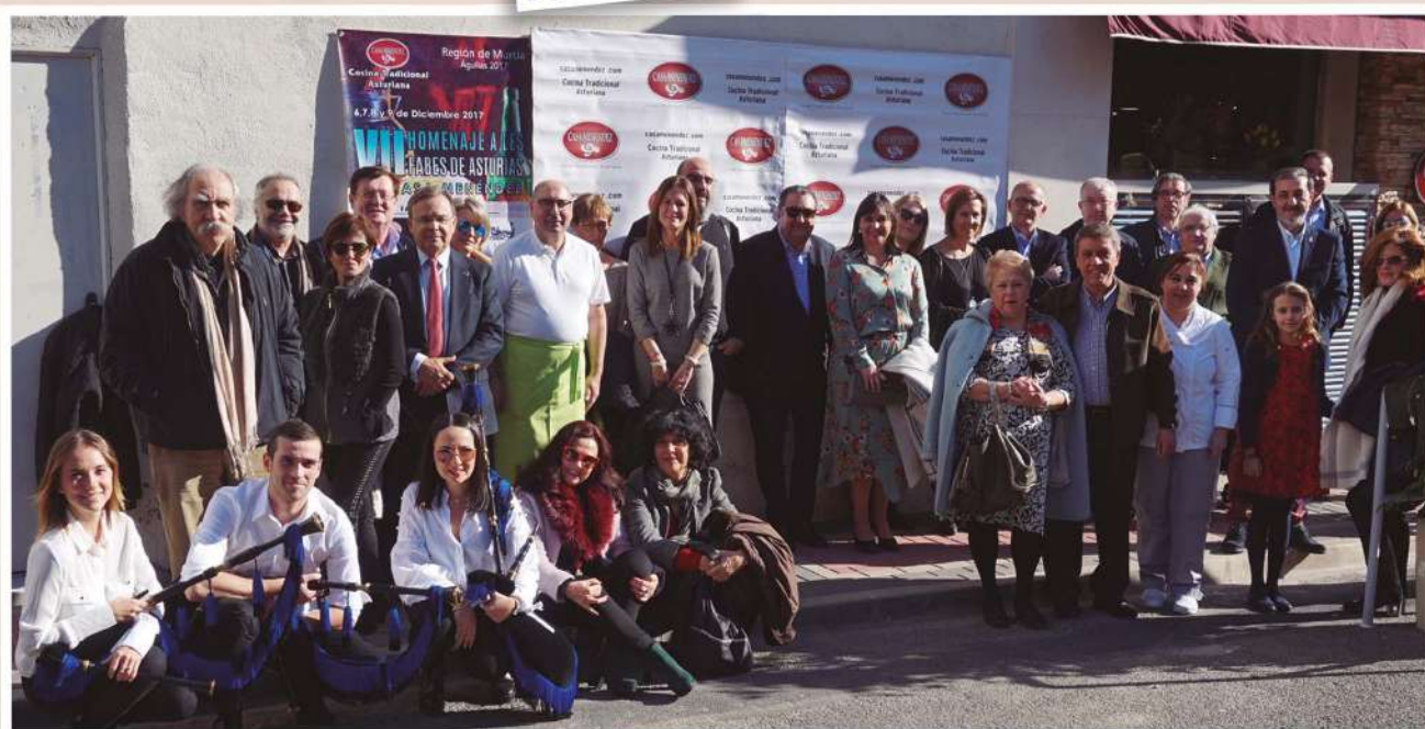
Los Parrandboleros, internacional formación musical murciana, Estrella de Levante y Restaurante "La Máquina" de Lugones (Asturias) son los premiados con la distinción de "Fabas de Oro 2017"