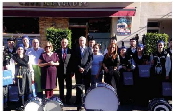
Banda de Gaitas de Rivadesella durante uno de los eventos gastronómicos de “Casa Menéndez”