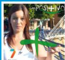
En Positivo 7RM