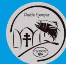
Caravaca de la Cruz Pueblo Ejemplar