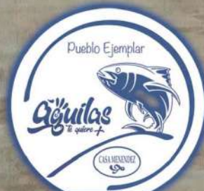
ÁGUILAS PUEBLO EJEMPLAR 2019